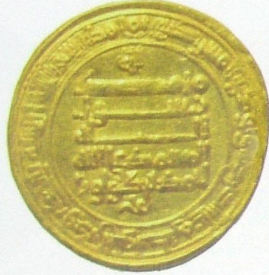
دينار طولوني السنة: ٢٦٦ هجري المدينة: مصر الحاكم: أحمد بن طولون Toloone Dinar Year: 266 H Mint: Egypt Ruler: Ahmad Bin-Toloone